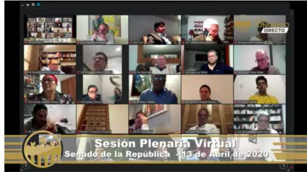
[Fotografía]. (2020). transmisión Canal Congreso . Recuperado de https://www.rcnradio.com/politica/lo-que-costara-plataforma-para-sesiones-virtuales-del-congreso

La confusión y hasta incertidumbre se registró por la falta de un acuerdo entre las cabezas directivas de ambas corporaciones, y ocurrió en el momento en que sobre el Poder Legislativo colombiano existe una enorme presión nacional para que labore, contribuya y aporte con el análisis, ideas, debates, reflexiones, proyectos y control a la complicada, compleja y preocupante situación actual y la del inmediato futuro, ocasionada por la emergencia viral. En el primer semestre de este 2020, el Congreso de la República debía reiniciar la segunda parte de la legislatura 2019 – 2020 el pasado 16 de marzo, pero las actividades regulares de senadores y representantes a la Cámara también se vieron interrumpidas por las urgentes medidas del Ejecutivo nacional, que decretó el aislamiento preventivo obligatorio para hacerle frente a la propagación del covid-19, sobre todo en Bogotá que es uno de los epicentros de la pandemia en el país.